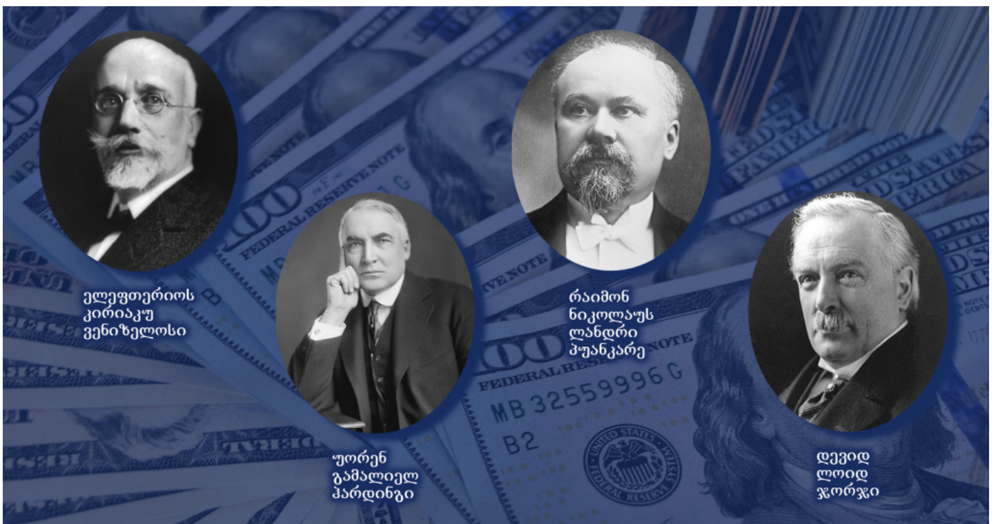
ელეფთეროს კირიაკუ ვენიზელოსი

გამტარებელი, პანელინელი და მაშინ ჯერ კიდევ ახალი ეკუმენისტური მოძრაობის პროპაგანდისტი. მელეტი გახდა ერთადერთი იერარქი მართლმადიდებლობაში, რომელიც თანმიმდევრობით მეთაურობდა სამ სხვადასხვა ადგილობრივ ავტოკეფალურ ეკლესიას: 1918-1920 წწ. – ათენისა და სრულიად ელადის მთავარეპისკოპოსი, 1921-1923 წწ. – კონსტანტინეპოლის პატრიარქი, 1926-1935 წწ. – ალექსანდრიისა და სრულიად აფრიკის პაპი და პატრიარქი. ის გახლდათ იმ წლებში საბერძნეთის ყველაზე გავლენიანი პოლიტიკოსის – ვენიზელოსის ძმისწული [ან დისწული – ПЛЕМЯНИК]. გარდა ამისა, მას მჭიდრო კავშირები ჰქონდა ანგლიკანურ ეკლესიასთან და არაერთხელი მიუღია ღვთისმსახურებაში მონაწილეობა კენტერბერის მთავარეპისკოპოსთან ერთად. მოქმედების სტილი, ანგლოსაქსონურ სამყაროსთან კავშირი და ერთიანი მართლმადიდებლური საზოგადოების იდეების უგულვებელყოფა ეკუმენიზმის სასარგებლოდ, ძალიან ანათესავებს მელეტის კონსტანტინეპოლის ახლანდელ პატრიარქ ბართლომეოსთან.