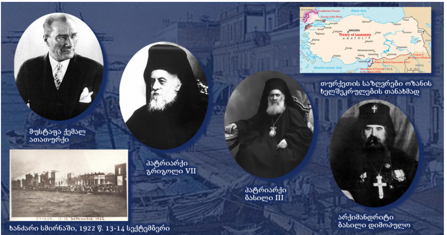
თურქეთის საზღვრები ოზანის ხელშეკრულების თანახმად