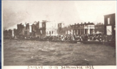
ხანძარი სმირნაში, 1922 წ. 13-14 სექტემბერი