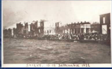
ხანძარი სმირნაში, 1922 წ. 13-14 სექტემბერი