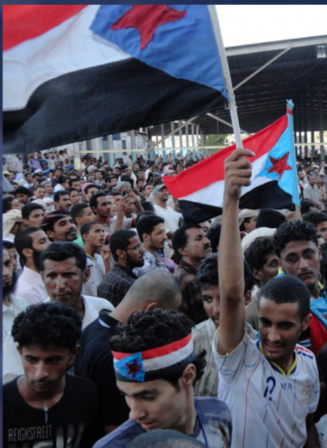
Arabischer Frühling, 2011

Zweitens, stießen beide Kirchen auf neue Herausforderungen, die sie zur Zusammenarbeit motivierten. Vor allem war es der Ablauf der Verfolgungen der Christen im Nahen Osten und Afrika. Nach der Invasion der USA in den Irak im Jahre 2003 sind die urchristliche Bevölkerung von Levant auf die Verfolgungen aus religiösen Gründen gestoßen. Sie brauchten die koordinierte Massenhilfe. In diesen Bedingungen entspann die Annäherung der Russischen Kirche und Vatikans. Als Beweis dient die Tatsache, dass der erhebliche Teil der gemeinsamen Deklaration von Papst Franziskus und Patriarchen Kyrill im Jahre 2016 nämlich dem Schutz der Christen gegen neue Verfolgungen gewidmet ist.