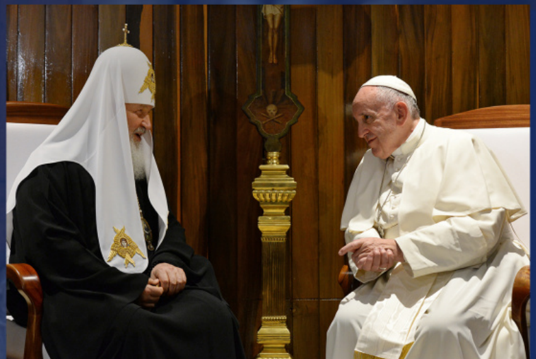
Das Treffen Seiner Heiligkeit des Patriarchen von Moskau und ganz Russland Kyrill mit dem Heiligsten Papst Franziskus, am 12. Februar 2016

Zur anderen Herausforderung, darauf die christliche Welt gestoßen ist, wurde der Eintritt vom aggressiven Laizismus. Während viele westliche Konfessionen den Weg der Anpassung ihres Erbes an der sich verändernden Welt bevorzugen, machten sich die Orthodoxen, Katholiken und konservativen Protestanten daran, sich für die traditionellen christlichen Werte einzusetzen. Obwohl es ganz schwer ist die Wirksamkeit der Arbeit in dieser Richtung einzuschätzen, veranlasst die Übereinstimmung der Meinungen von den Orthodoxen und Katholiken in dieser Frage sie dazu die neuen Formen der