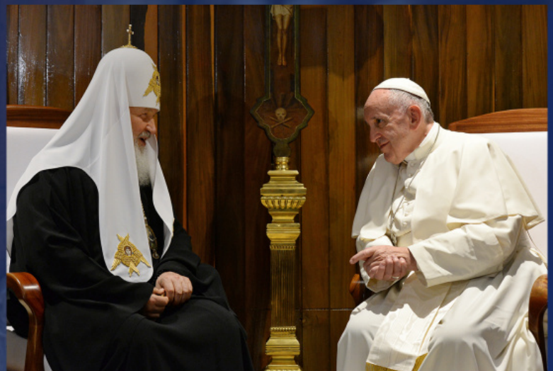
Das Treffen Seiner Heiligkeit des Patriarchen von Moskau und ganz Russland Kyrill mit dem Heiligsten Papst Franziskus, am 12. Februar 2016

Zur anderen Herausforderung, darauf die christliche Welt gestoßen ist, wurde der Eintritt vom aggressiven Laizismus. Während viele westliche Konfessionen den Weg der Anpassung ihres Erbes an der sich verändernden Welt bevorzugen, machten sich die Orthodoxen, Katholiken und konservativen Protestanten daran, sich für die traditionellen christlichen Werte einzusetzen. Obwohl es ganz schwer ist die Wirksamkeit der Arbeit in dieser Richtung einzuschätzen, veranlasst die Übereinstimmung der Meinungen von den Orthodoxen und Katholiken in dieser Frage sie dazu die neuen Formen der