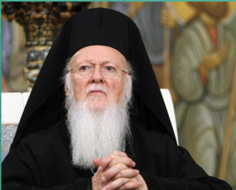
Патриарх Вартоломей I

Като какъв ни се представя Константинопол днес? Разбира се, моите приятели и познати, които все още се вълнуват от мненията и действията на Патриарх Вартоломей и другите фанариотски величия, ще предпочетат да представят Фенер така, както най-често го изобразяват другите: това ще е историята за древната катедра на свети апостол Андрей, за една поместна Църква, непрекъснато съществуваща вече две хилядолетия. Естествено, всеки, дори най-повърхностен познавач на църковната история на Православната Църква би могъл с право да възрази на почитателите на Фенер: все пак така никога и не е ставало ясно как константинополската катедра се отнася към твърде мътните страници на собствената си история, към времената, когато катедрата на Патриарх Вартоломей са заемали създатели на ереси?