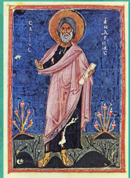
Свети апостол Андрей Първозвани. Книжна миниатюра, Византия, XII в.

Ако отговорът на този въпрос, да го кажем така, е просто отрицателен – в случай, че имаме предвид Несторий или Пир, то тогава по какъв начин днешният Фенер се отнася, да кажем, към патриарсите, заемали константинополския престол по времето между Флорентийския събор през 1439 г. и падането на Константинопол през 1453 г.? Интересна историческа перспектива ни предлага следният факт: въпреки че патриарх Генадий Схоларий след падането на Константинопол е скъсал окончателно с униатската политика на своите предшественици, самата катедра така и не е признала законността на решението на Руската Църква да се отдели от Константинопол по времето, когато той е поддържал унията с Рим. Са ли днешните константинополски патриарси наследници на онези, които са починали навремето в единство с Рим? Впрочем, може би днешната църковно-политическа линия на Фенер напълно съответства на онази позиция, според която днес тази катедра е легитимен наследник на патриарсите-униати.