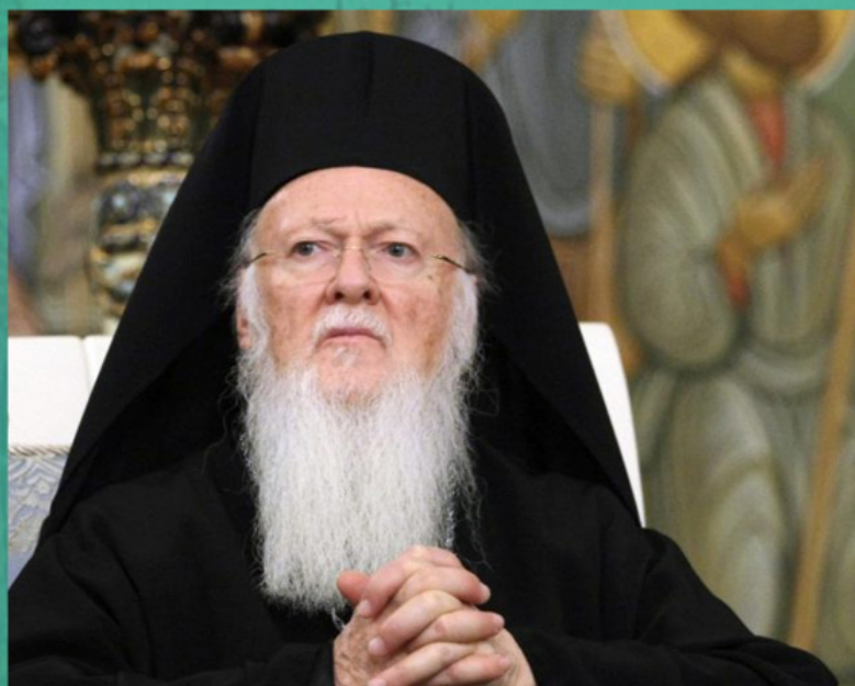
Патриарх Вартоломей I

Като какъв ни се представя Константинопол днес? Разбира се, моите приятели и познати, които все още се вълнуват от мненията и действията на Патриарх Вартоломей и другите фанариотски величия, ще предпочетат да представят Фенер така, както най-често го изобразяват другите: това ще е историята за древната катедра на свети апостол Андрей, за една поместна Църква, непрекъснато съществуваща вече две хилядолетия. Естествено, всеки, дори най-повърхностен познавач на църковната история на Православната Църква би могъл с право да възрази на почитателите на Фенер: все пак така никога и не е ставало ясно как константинополската катедра се отнася към твърде мътните страници на собствената си история, към времената, когато катедрата на Патриарх Вартоломей са заемали създатели на ереси?