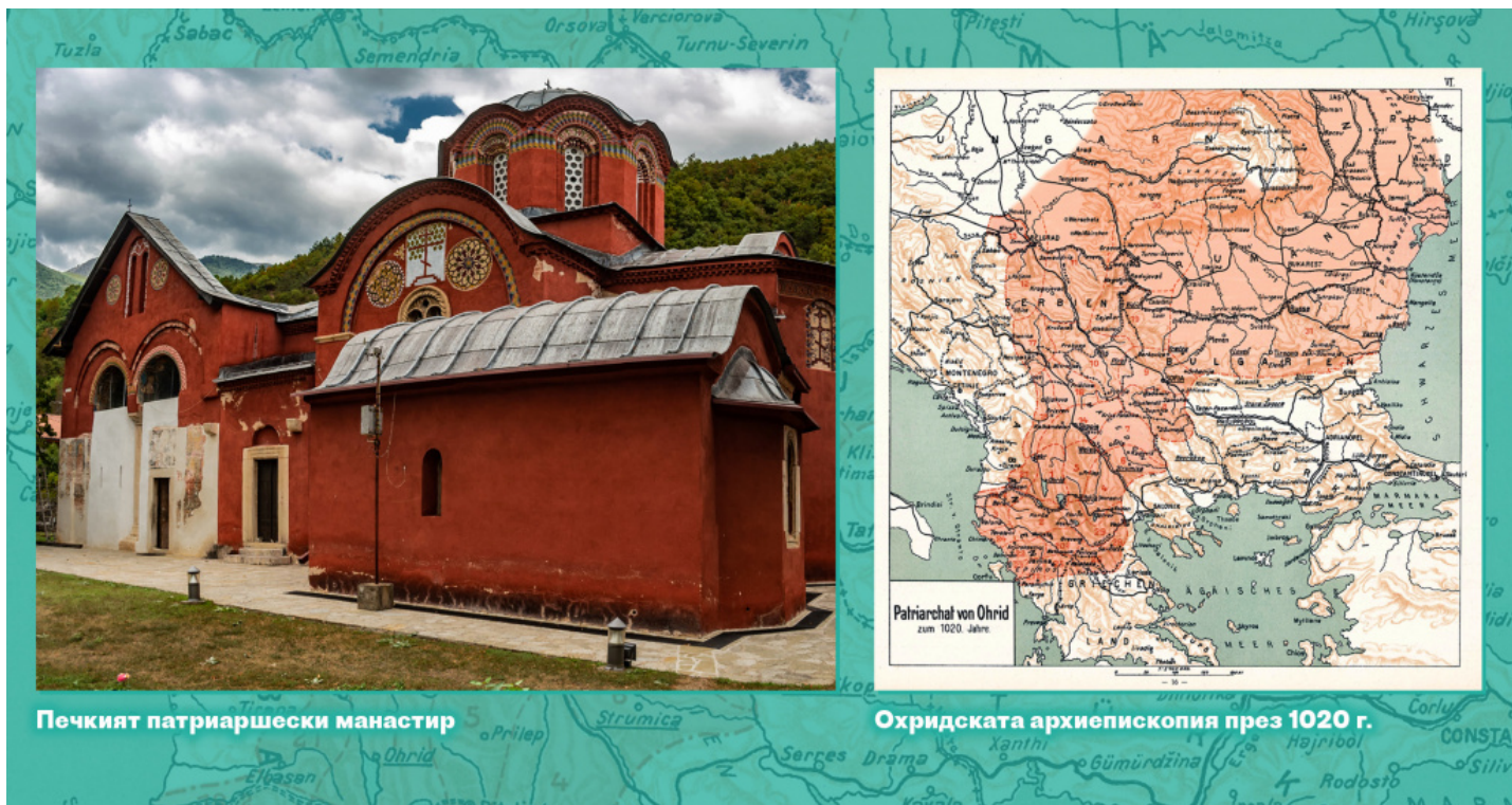
Печкият патриаршески манастир