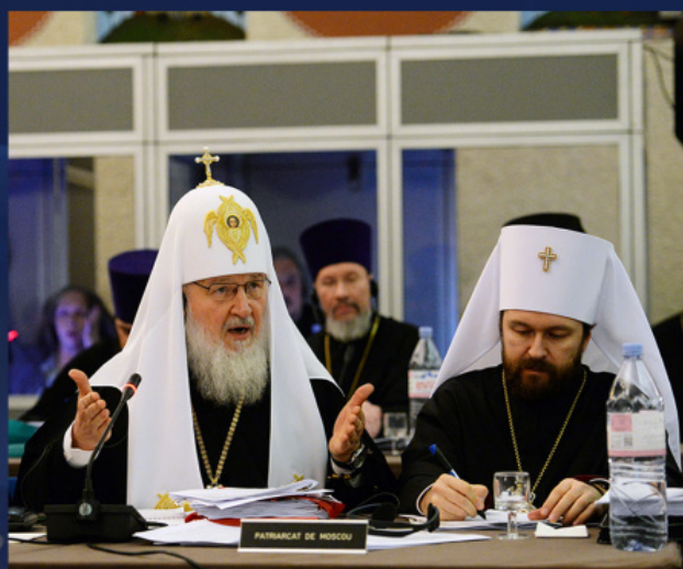
Светейшият Патриарх Московски и Всеруски Кирил и митрополит Иларион на събранието на предстоятелите на поместните Православни църкви. Шамбези, Швейцария, 22-27 януари 2016 г.

На Синаксиса на предстоятелите през 2014 г. бе решено, че темата «автокефалия» ще се обсъжда отново в рамките на подготвителна комисия, за да бъде поставена на Всеправославния събор. Но обсъждането така и не се състоя, формално поради недостиг на време. Въпреки това през 2015 г. предстоятелите на Грузинската, Сръбската и Българската Православни Църкви в писма до патриарх Вартоломей се изказаха за внасяне на темата «автокефалия» в дневния ред на Светия и Велик събор.