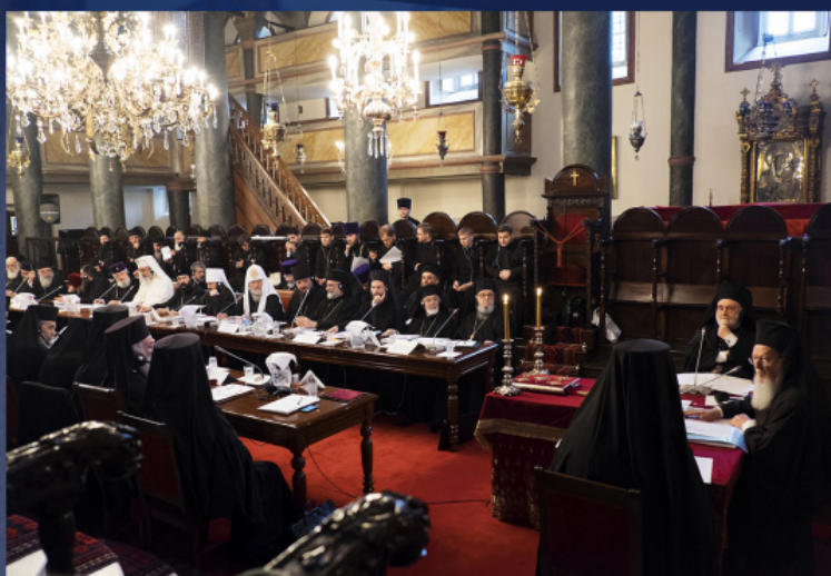
Синаксис на предстоятелите и представителите на поместните Православни църкви. Истанбул, Турция, 6-9 март 2014 г.

И все пак през април 2011 г. въпросът за автокефалията бе временно свален от обсъждане по инициатива на Константинополския патриарх Вартоломей, който разпрати писма до поместните Православни Църкви с предложение да се проведе Всеправославен събор, а дискусиата по спорния въпрос да се отложи до по-добри времена.