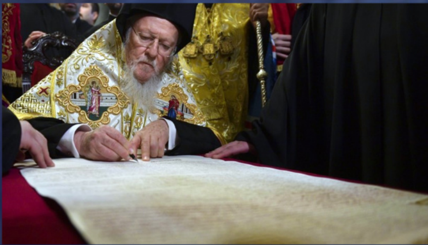
Патриарх Вартоломей подписва томоса за автокефалията на Православната църква на Украйна