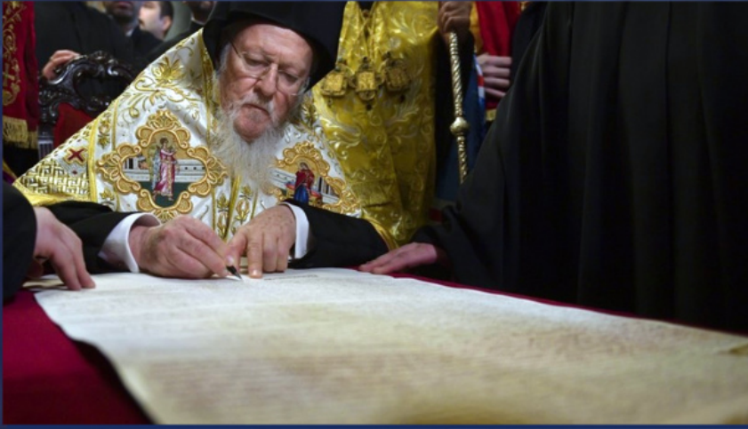
Патриарх Вартоломей подписва томоса за автокефалията на Православната църква на Украйна