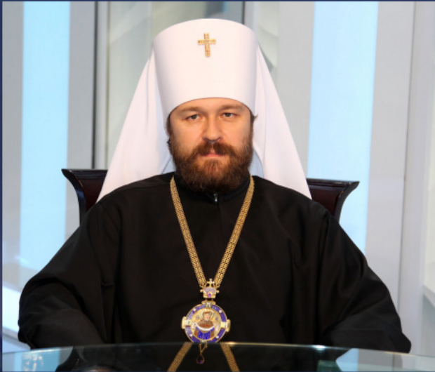
Митрополит Иларион, участник в заседанията на Междуправославната комисия за подготовка на Светия и Велик събор на 10-16 декември 2009 г. и 22-26 февруари 2011 г. в Шамбези.