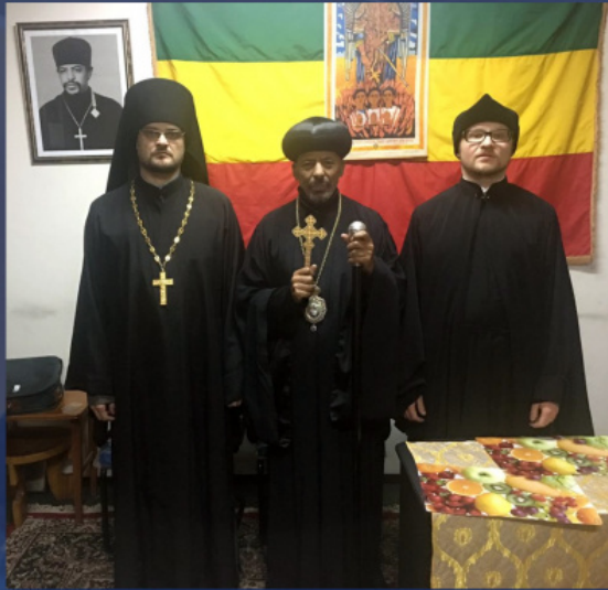
Делегация на Руската Православна Църква в Етиопия