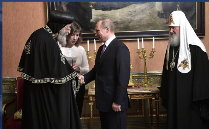
Среща на В. В. Путин с Патриарха на Коптската църква Тавадрос II и Патриарха на Москва и цяла Русия Кирил

Тесни връзки свързват Коптската Църква с Московската Патриаршия, особено през последните 7 години. Коптската Църква бе първата от Древните Източни Църкви, с която Руската Православна Църква създаде Комисия за диалог (през 2016 г.). Комисията продължава работата си и днес. Патриарх Тавадрос два пъти посети Русия (през 2014 и 2017 г.), срещаше се с Президента на Руската Федерация В. В. Путин и Светейшия Патриарх Московски и на цяла Русия Кирил. Коптската Църква и Московската Патриаршия неведнъж обменяха делегации от представители на медиите, синодалните отдели, както и монашески делегации.