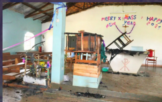
Църква в Кения след пожар

В последно време нарасна активността на терористическите групировки в Демократична Република Конго (ДРК), Централноафриканската република, Камерун и Мозамбик. Основна заплаха за християнското население на ДРК е екстремистката групировка «Обединени демократични сили» (ОДС). Само през 2020 г. ОДС са отговорни за 849 убийства сред гражданското население, главно на християни. През 2021 г. терористите на ОДС извършиха серия от масови убийства на мирни граждани, най-вече в християнски селища. Общо загинаха 100 човека. През март 2021 г. терористите извършиха серия от нападения срещу населението: жертви станаха десетки християни. Няколко десетки души загинаха в резултат на нападението на