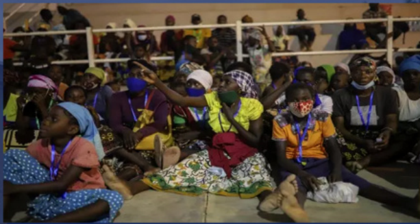
Хиляди хора очакват евакуация. Палма, Мозамбик