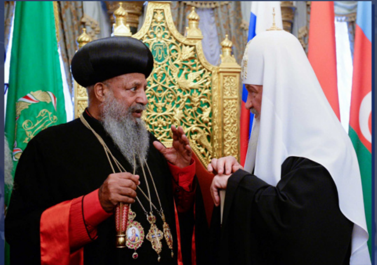
Етиопският Патриарх Абуна Матфий и Светейшият Патриарх Кирил

През декември 2019 г. Светейшият Патриарх Кирил изпрати до Етиопския Абуна Матфий и министър-председателя на Етиопия А. Али писма, в които изрази загрижеността си от тревожното развитие на ситуацията и своята подкрепа. В писмото на Негово Светейшество бе отбелязано, че събитията в Етиопия стоят в една редица с гоненията срещу християнските Църкви в много региони на света, където определени сили се опитват да използват религиозния фактор за да постигнат своите политически цели, както и за да отслабят и сплашат традиционните християни.