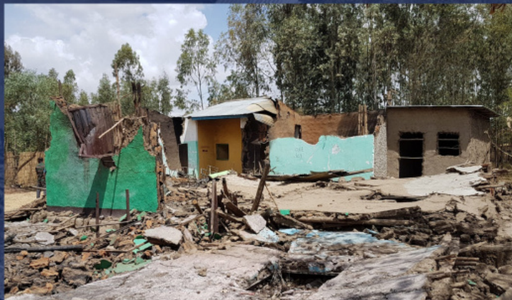
Останки от църква след нападение в Етиопия

Руската Православна Църква предприема активни усилия за защита на християните от Африка. През последните години са установени преки контакти с основните християнски Църкви на континента, в това число с най-големите от тях – Етиопската и Коптската. Работата с тях се осъществява от Руската Православна Църква в рамките на двустранните комисии за диалог. Предстоятелите на Етиопската и Коптската Църква нееднократно посещаваха Русия.