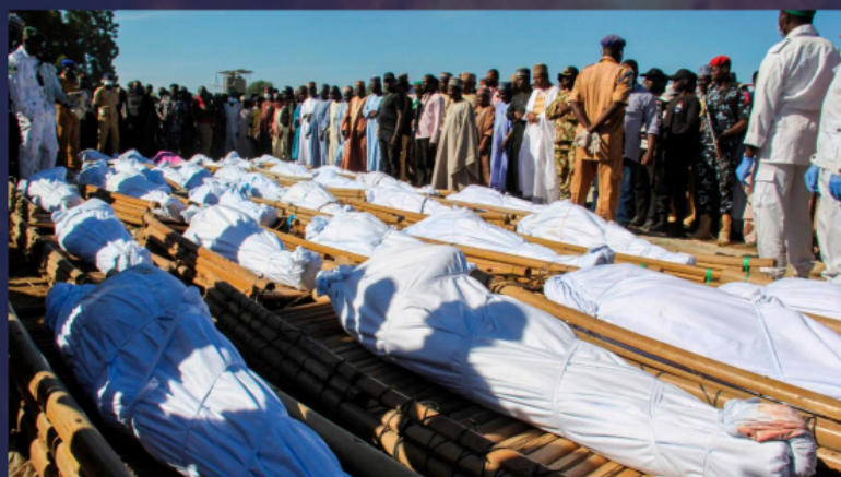
Погребение на убити селяни в Нигерия

В Източна Африка, в Сомали, Кения и съседните страни гонения срещу християните извършва терористическата групировка «Аш-Шабааб». Основна тактика на терористите са хайките срещу междуградските автобуси, където те отделят християните от мюсюлманите и ги убиват. В Кения в началото на 2021 г. беше извършена серия подпалвания на църкви.