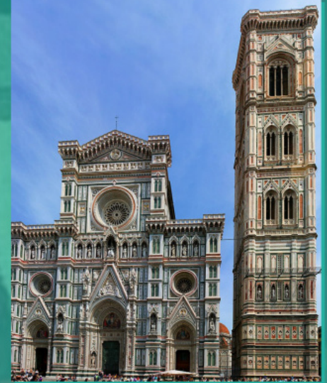
Катедралата «Санта Мария дел Фиоре», където през 1439 г. е подписана Флорентийската уния

В отчаян опит да спасят държавата византийските императори и църковни политици два пъти решават да се поклонят на Запада, приемайки продиктуваните от Рим условия на Лионската (1274) и Флорентийската (1439) унии. Но и единия, и другия път тези църковни компромиси не само не донасят очакваните външнополитически дивиденди, но и предизвикват мощен протест в страната.