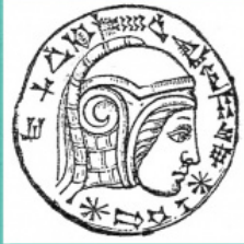
Изображение на Навуходоносор II. Вавилонска камя.