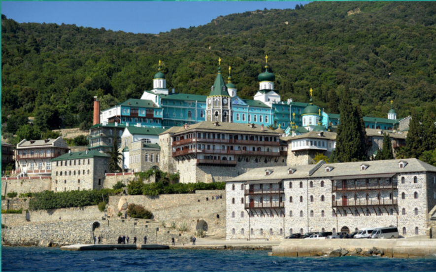
Манастирът «Св. Пантелеймон» на Света Гора