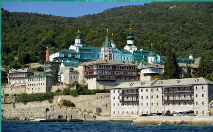
Манастирът «Св. Пантелеймон» на Света Гора