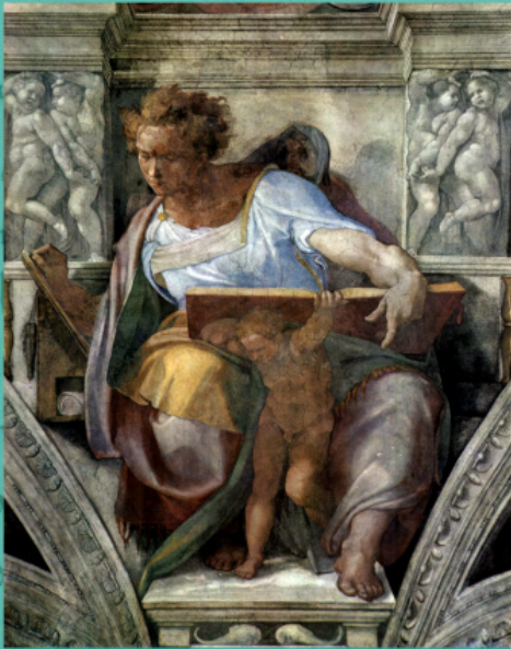
Пророк Даниил. Стенопис на Микеланджело Буонароти, Сикстинска капела, Ватикана, 1511 г.