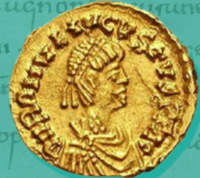
Тремис с портрета на Ромул Август

Именно такава тълкувание дава на Книга Даниил св. Иполит Римски (III в.) и впоследствие то става твърде популярно. Между другото, Иполит, пресмятайки сроковете на отминалите царства, предположително изчислява и времето на римското господство: 500 години. И наистина, между учредяването на империята по времето на Август (30 г. до Хр.) и нейната гибел при Ромул Августул (476 г.) изминава почти точно толкова време — 506 години. «Пада» обаче само западната половина. Източната Римска империя, която познаваме като Византия, не просто оцелява: тя съществува още почти 1000 години.