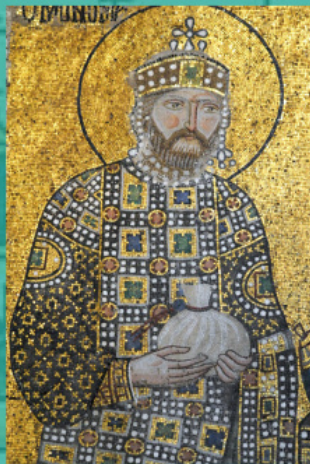
Константин IX Мономах. Фрагмент от мозайка в храма «Света София» в Константинопол, средата на XI в.