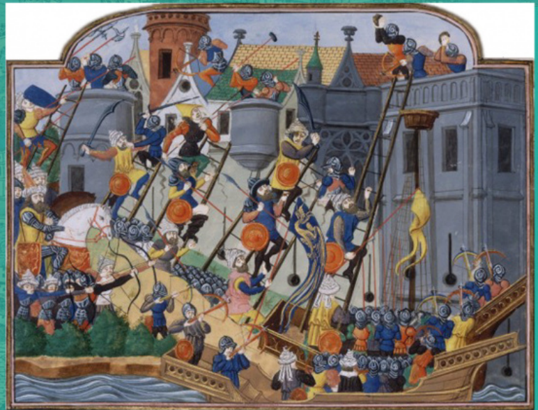
Обсадата на Константинопол. Миниатюра на Филип дьо Мазерол от ръкописа «Хроники на Карл VII» на Жан Шартие, XV в.