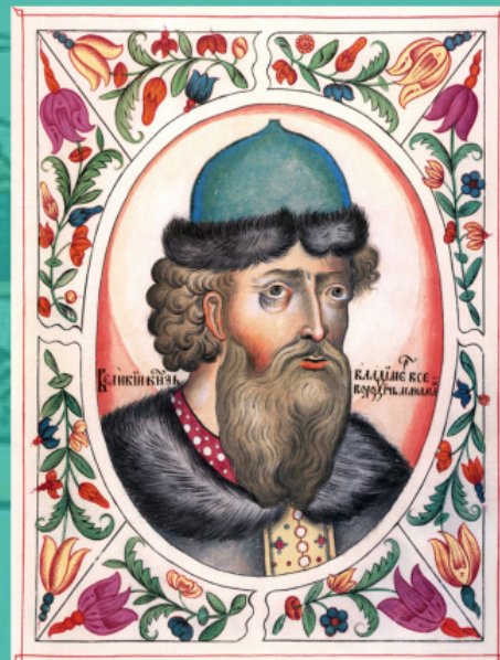
Владимир Всеволодович Мономах. Портрет от «Царския титулярник», XVII в.

Характерно е, че императорът тук ни най-малко не отстъпва титлата си и централното си място на покровител на целия православен свят, но сякаш присъединява към своето служение руския княз — признан за «волен и самодържавен» цар на Велика Русия. Именно тази титла ще «възстанови» през 1547 г. Иван Василиевич Грозни по времето на своята знаменита коронация.