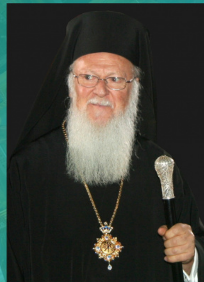
Патриарх Вартоломей I

Миражът на «славянската заплаха» се оказва толкова силен, че дори е повлиял върху отказа на гръцките учени да използват историческото име «Русик» (Ῥωσικόν) за атонския манастир «Св. Пантелеймон». А в днешното си деструктивно противопоставяне на Московската патриаршия заради Украйна Константинополският патриарх Вартоломей и неговите съмишленици се стремят да разиграят картата на «елинската солидарност», зовейки настойчиво гръцките йерарси от другите поместни Църкви да застанат на явно неканоничната страна.