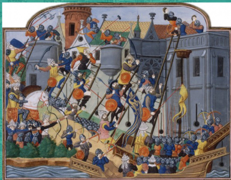
Обсадата на Константинопол. Миниатюра на Филип дьо Мазерол от ръкописа «Хроники на Карл VII» на Жан Шартие, XV в.