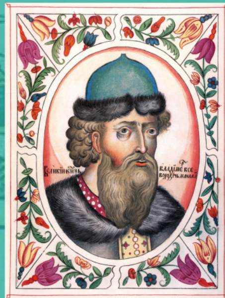
Владимир Всеволодович Мономах. Портрет от «Царския титулярник», XVII в.

Характерно е, че императорът тук ни най-малко не отстъпва титлата си и централното си място на покровител на целия православен свят, но сякаш присъединява към своето служение руския княз — признан за «волен и самодържавен» цар на Велика Русия. Именно тази титла ще «възстанови» през 1547 г. Иван Василиевич Грозни по времето на своята знаменита коронация.