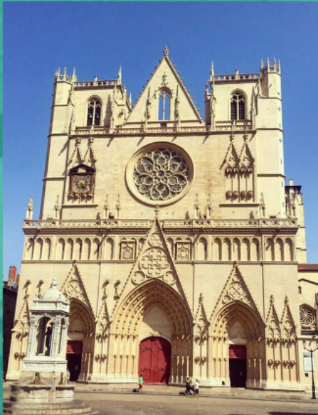
Църквата «Сен Жан», където през в 1274 г. е подписана Лионската уния.