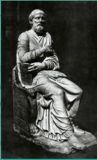
Древна римска скулптура, възможно на св. Иполит Римски (III в.), намерена през 1551 г. на Виа Тибуртина в Рим. Ватиканска библиотека, IV-V в.