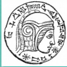
Изображение на Навуходоносор II. Вавилонска камя.