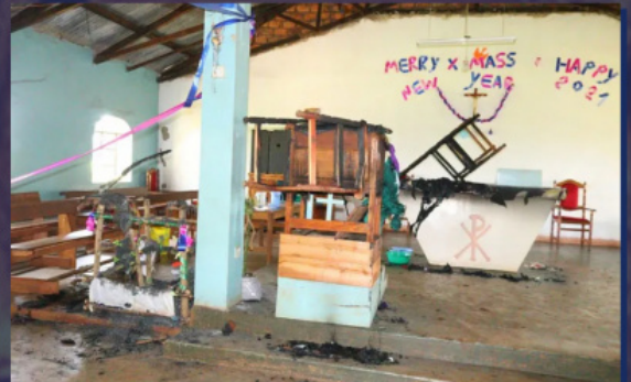
ეკლესია კენიაში ხანძრის შემდეგ

უკანასკნელ დროს ტერორისტული ჯგუფები გააქტიურდნენ კონგოს დემოკრატიულ რესპუბლიკაში (კდრ), ცენტრალურ აფრიკულ რესპუბლიკაში, კამერუნში და მოზამბიკში. კდრ-ს ქრისტიანი მოსახლეობისათვის ძირითად საფრთხეს წარმოადგენს ექსტრემისტული დაჯგუფება „გაერთიანებული დემოკრატიული ძალები“ (გდძ). მხოლოდ 2020 წელს გდძ-ს კისერზეა 849 ადამიანის სიკვდილი სამოქალაქო მოსახლეობას შორის – ძირითად, ქრისტიანების. 2021 წლის იანვრში გდძ-ს ბოევიკებმა მშვიდობიანი მოსახლეობის მთელი რიგი მასობრივი მკვლელობა ჩაიდინეს, – უმთავრესად ქრისტიანულ