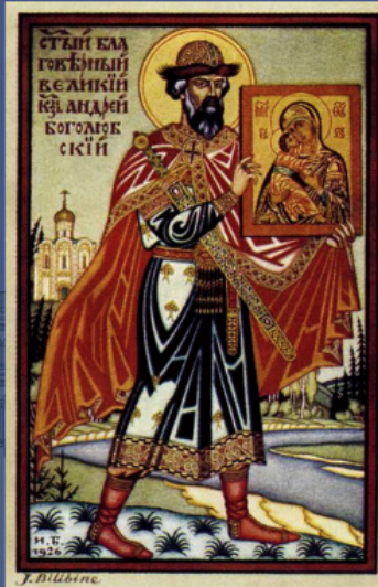
Ο Ανδρέας Γιούριεβιτς Μπογκολιούμπσκι. Ταχυδρομική κάρτα, έργο του Ι. Μπιλίμπιν.