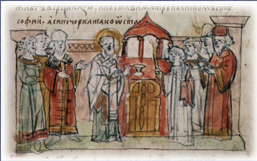
Η ενθρόνιση του μητροπολίτη Ιλαρίωνα. Μικρογραφία από το Χρονικό του Ραντζιβίλ, 15 ος αι.