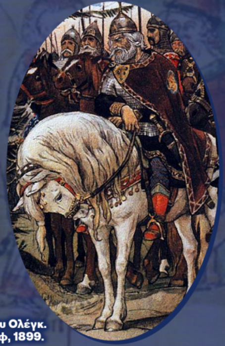
Ο πρίγκιπας του Κιέβου Ολέγκ. Έργο του Β. Βασνετσόφ, 1899.

Το Κίεβο καθίσταται για τη Γη των Ρως ρυθμιστής των τάσεων στον τομέα της υψηλής τέχνης, η οποία την εποχή του Μεσαίωνα ήταν αποκλειστικώς θρησκευτική. Με τη σειρά της η κιεβιάνικη παράδοση τρέφεται με τους χυμούς του βυζαντινού πολιτισμού, ο οποίος εκείνη την εποχή είχε φθάσει στο απόγειό του. «Μεγάλη διαδοχή» χαρακτήριζε την ανάπτυξη της Ρωσίας μετά την υιοθέτηση του χριστιανισμού ο ιστορικός της τέχνης Λ. Λιουμπίμοφ. Ο ακαδημαϊκός Ντ. Λιχατσόφ θεωρούσε μάλιστα ότι η λέξη «επιρροή» ελλιπώς αποτυπώνει την πραγματική σημασία του Βυζαντίου στη ρωσική ιστορία: «Επομένως, σε πολλές περιπτώσεις είναι ορθότερο να μιλάμε όχι για “επιρροή” μεμονωμένων πολιτιστικών φαινομένων του Βυζαντίου, αλλά για μεταφορά αυτών των φαινομένων». Οι καλύτεροι βυζαντινοί αρχιτέκτονες εργάζονται για την ανέγερση των ναών του Κιέβου, ταλαντούχοι αγιογράφοι δημιουργούν για αυτούς αστραποβολούντα ψηφιδωτά, λαμπρές τοιχογραφίες και μεγαλοπρεπείς εικόνες, κομψοί λάτρεις του λόγου κοπιάζουν για τις εκδόσεις βιβλίων, «τα οποία γεμίζουν ποταμηδόν την Οικουμένη» και τις βιβλιοθήκες του Κιέβου.