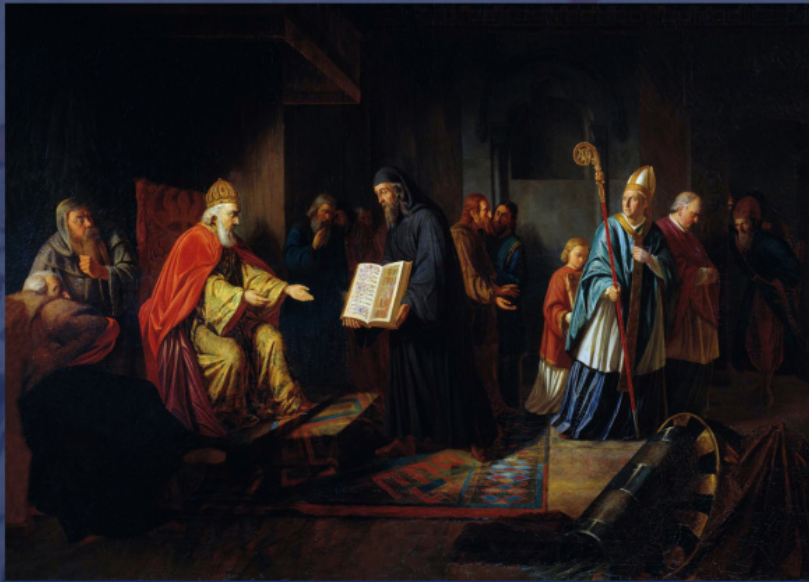
Ο μεγάλος πρίγκιπας Βλαδίμηρος επιλέγει θρησκεία. Έργο του Ι. Έγκινκ, 1822.

Η Ιερά Μονή Κοιμήσεως της Θεοτόκου των Σπηλαιών του Πσκοφ.